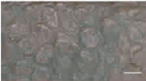
图2 四川巨棘龙皮肤印痕化石右上区域左部的鳞片(比例尺为5cm) Fig. 2 Scales on the left of the upper right part of skin impressions of Gigantspinosaursichuanensis