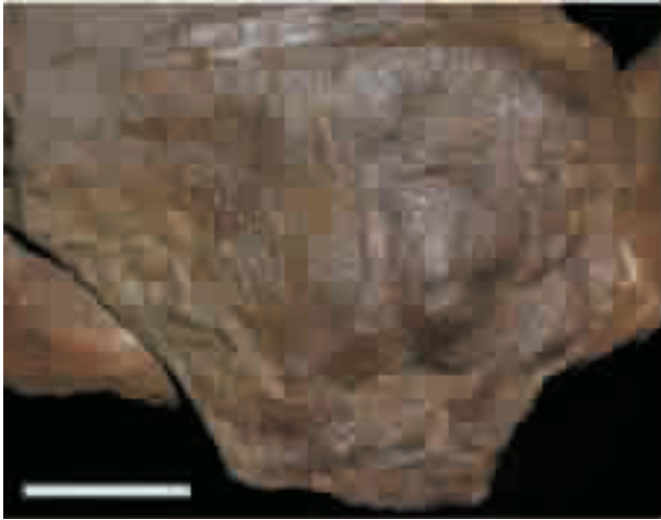
图1 四川巨棘龙皮肤印痕化石(ZDM0019,比例尺=10cm) Fig. 1 Photograph of skin impressions of Gigantspinosaursichuanensis

剑龙类皮肤及其印痕化石最早由Marsh [30] 于1881年描述,以后亦有数次发现。在这些标本中,