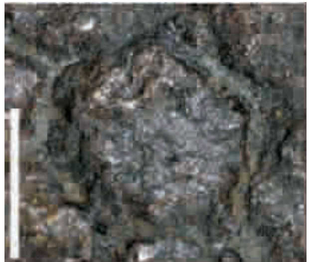
图4 四川巨棘龙皮肤印痕鳞片特写(比例尺为5cm) Fig. 4 Close-up of the scale of skin impressions of Gigantspinosaursichuanensis